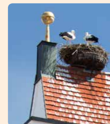
EIN HERZLICHES WILLKOMMEN ALLEN NEUBÜRGERN/-INNEN!