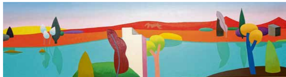
Bilder: Bärbel Schoen

50 auf 190 Zentimeter misst dieses Ölbild von Julia Steinberg. Malerei ist für die Künstlerin eine Verdichtung von Form und Farbe. Das Sujet dient letztlich als Anlass und Katalysator für ungewöhnlich eindringliche Farbkombinationen