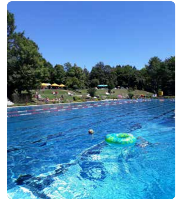
Bilder: Johannes Deisenhofer