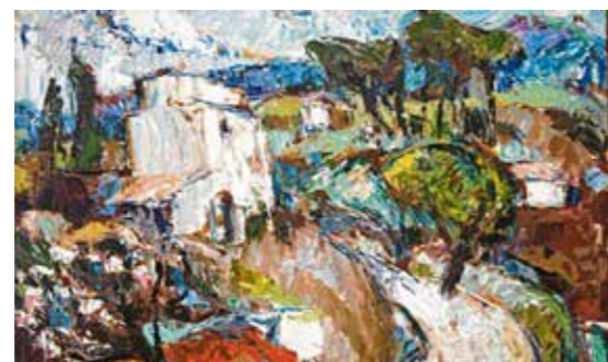
Walter Geggerle hat dieses 50 mal 68 Zentimeter große Bild in den 60er Jahren während einer Studienreise in Frankreich gemalt. Es trägt den Titel „Cadiniere“