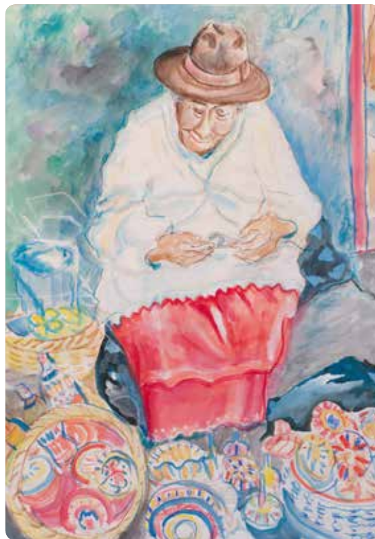
VERDIENST - Toquilla - Weberin in Cuenca, Ecuador, 2016

Stadtgalerie Dillingen Schützenstraße 1e 89407 Dillingen