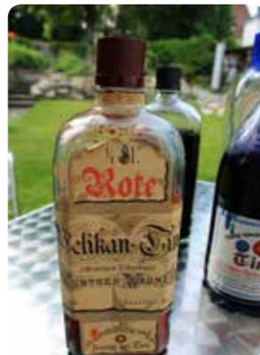
Der Dachbodenfund in der Grundschule Wertingen