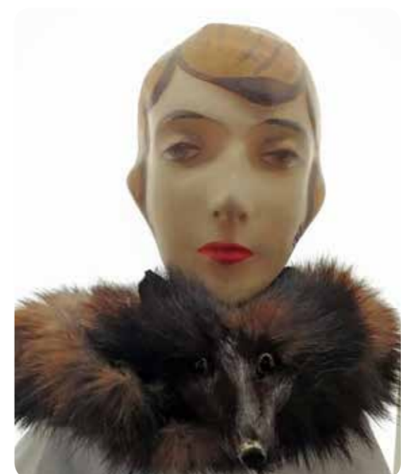
Die Fuchsstola im Heimatmuseum Wertingen