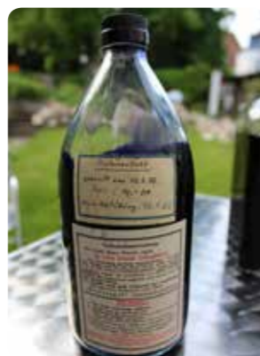
Bilder oben: Tintenextrakt, 1959 erworben, Vorder- und Rückseite